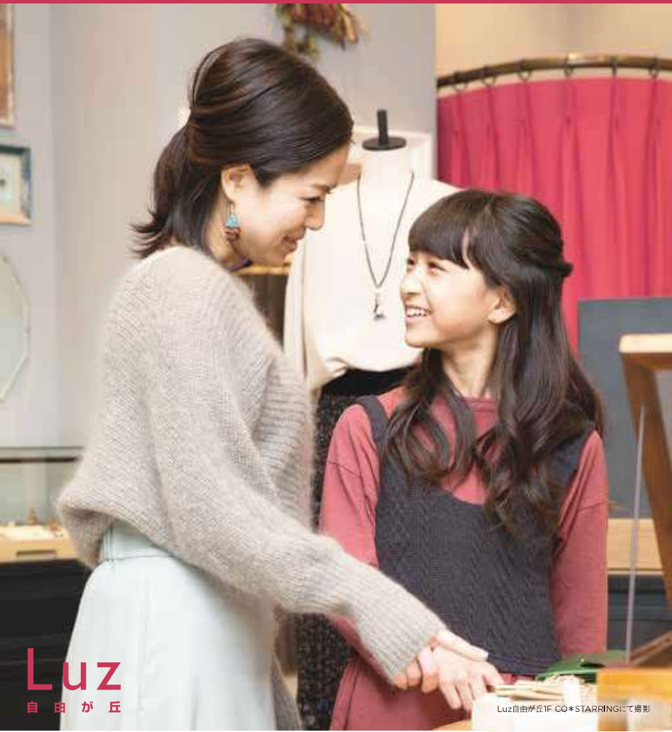
Luz自由が丘1F CO*STARRINGにて撮影

MARKEY'S YOUTH THEATRE JAPAN ORAL CLINIQUE JIYUGAOKA besta CABRILLOS