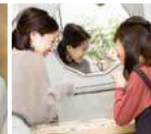
ママお花びらピアス、タッセルピアス 1F CO*STARRING